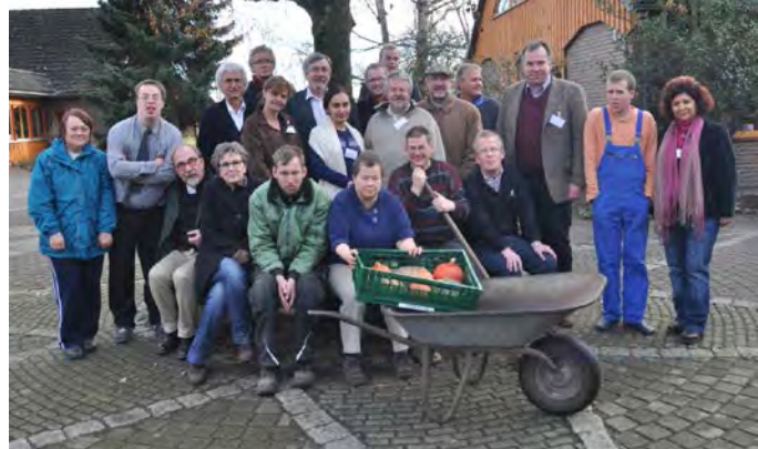
Auftakttreffen des Gesamtteams in Hardebek

Bereits im DASoL-Rundbrief Nr. 14 wurde über das Inclufar-Projekt berichtet. Im Rahmen des im Oktober 2013 begonnenen Transfer of Innovation -Projekts besteht das Ziel, das von der Hofgemeinschaft Weide-Hardebek entwickelte FAMIT-Curriculum („Fachkraft für Milieubildung und Teilhabe“), das seit 2006 in Schleswig Holstein als Sozialtherapeutische Zusatzqualifikation (SPZ) anerkannt ist, in angepasster Form in weiteren europäischen Ländern verfügbar zu machen und umzusetzen.