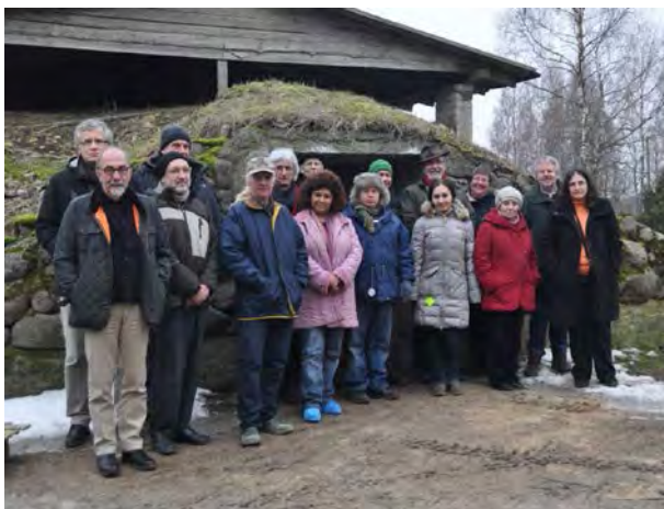
Impressionen vom Projekttreffen in Estland